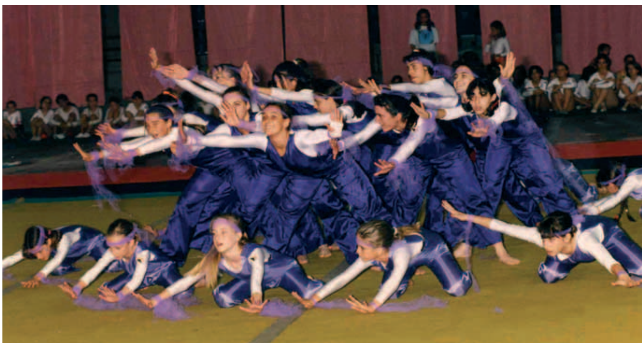
Sopra: una delle coreografie all'Accademia annuale al Palasport. In alto a sinistra: La squadra i Ginnastica Ritmica della Rubattino, che nel 1997 ha vinto lo scudetto al Campionato Italiano di serie A1. In alto a destra: La Rubattino con i suoi corsi di avviamento alla ginnastica in una esibizione allo stadio Luigi Ferrarsi di Genova